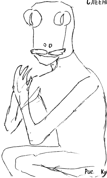
Рис. Кручининой Л.Д.

– Дорогая Мария – сестра моя, я рад, что ты решила со мной поговорить, я ждал. На самом деле я с Кассиопеи, правильно Дмитрий понял – я там долго жил, потом пришел в вашу область Вселенной и поселился на Сириусе Б, и там до сих пор живу. Я Светлым был всегда, но с темнотой тоже сталкивался в жизнях своих. Сейчас я здесь.