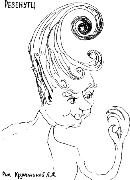
Рис. Кручининой Л.А.

на полы. Там, где я эволюционировал с 1- мерного пространства, не такие были Законы. Ваша Космическая Иерархия Светлых Сил – самая выдающаяся в Космосе и широко известна. Они для нас учителя, как академики. По силе Сердца нет им равных. Световые Иерархии есть разных типов. Из ваших книг известно вам, что есть эволюционирующие ветви 4-х стихий: Огонь, Вода, Земля и Воздух. Ваше человечество относится к стихии Воды – эмоциональной и сердечной (вся гуманоидная ветвь к ней относится) и ваша Иерархия вышла из них (вас) же. Я отношусь к Огненной ветви – где преобладающим качеством является Творческий Огонь. Творец един, Любовь едина, она первооснова и каркас всего, но поверх наложения разные бывают. На 1-м месте у огненных ветвей не Сердце, а Творческий Огонь – азарт творения и горит он так же в груди у нас, где у вас сердце. Посмотрите на описание 4-х типов стихий, которые дает вам астрология ваша. «Как вверху, так и внизу» – это общий Закон Космоса, но опять относительно. Итак, у Огненных ветвей другая Иерархия. И я хотел бы продолжать эволюцию в более высокие своих мирах. Дорогая Маша, спасибо за то, что не отказалась принять мою информацию. Я тоже посылаю тебе Любовь и прошу разрешения иногда выходить с тобой на контакт и общаться.